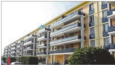
La résidence Lurian, avec la création de balcons.

avoisinentes a conduit à privilégier un bâti collectif, mais sous forme de petits bâtiments très ouverts, en deux îlots", note le responsable.